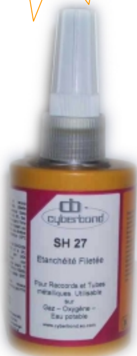
Flacon Accordéon Grande Contenance 75 ml

Une résine d'étanchéité Economique , rapide et durable